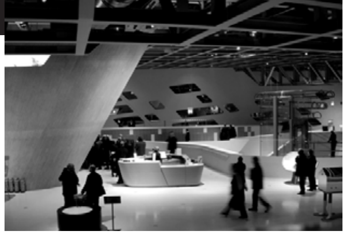
Phaeno Bilim Merkezi'nin Açılışı, Wolfsburg-Almanya

2004 Mimarlık Festivali kapsamında gösterime giren belgesel niteliğindeki "Zaha Hadid'le Bir Gün" adlı filmi ise, Türk sanatseverlerin yoğun ilgisi üzerine iki kez üst üste seyirciyle buluştu.