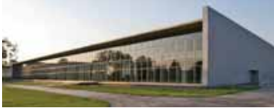
İpekyol Tekstil Fabrikası, Emre Arolat Mimarlık, Edirne, Türkiye