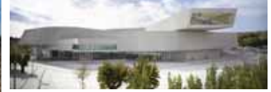
MAXXI Ulusal XXI. yüzyıl Sanatları Müzesi, Zaha Hadid