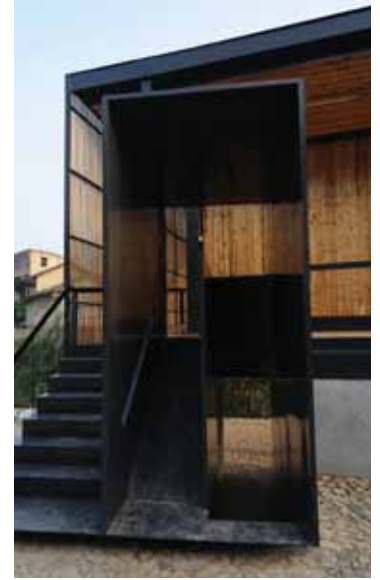
Köprü Okul, Xiashi, Fujian, Çin

Emre Arolat Mimarlık, İpekyol Tekstil Fabrikası yapısı ile dünyanın en prestijli mimarlık ödülllerinden biri olan ve 1977 yılından beri her üç senede bir çağdaş, başarılı mimari ve kentsel tasarım örneklerine verilen Ağa Han Mimarlık Ödülü'nü bu yıl Türkiye'ye kazandıran mimar oldu. İpekyol Tekstil Fabrikası 11. Ağa Han Mimarlık Ödülleri Mastır Jürisi'nin değerlendirmesine göre, çalışanların refahı ile işverenin üretim hedeflerinin mekâna entegrasyonunda mimar ve işverenin başarılı işbirliğine iyi bir örnek teşkil etmesi ile yönetim ve üretim alanlarını aynı çatı altında buluşturan ve dünyadaki endüstri yapılarının pek çoğunda rastlanan hiyerarşik düzenleme ve kötü yaşam koşullarından uzak duran mimari çözümlemesiyle 11. Ağa