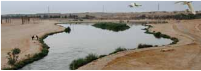
Wadi Hanife Sulak Arazisi, Riyad, Suudi Arabistan