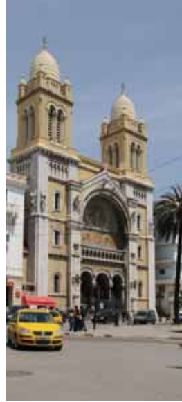
Tunus Hipermerkezinin Canlandırılması, Tunus