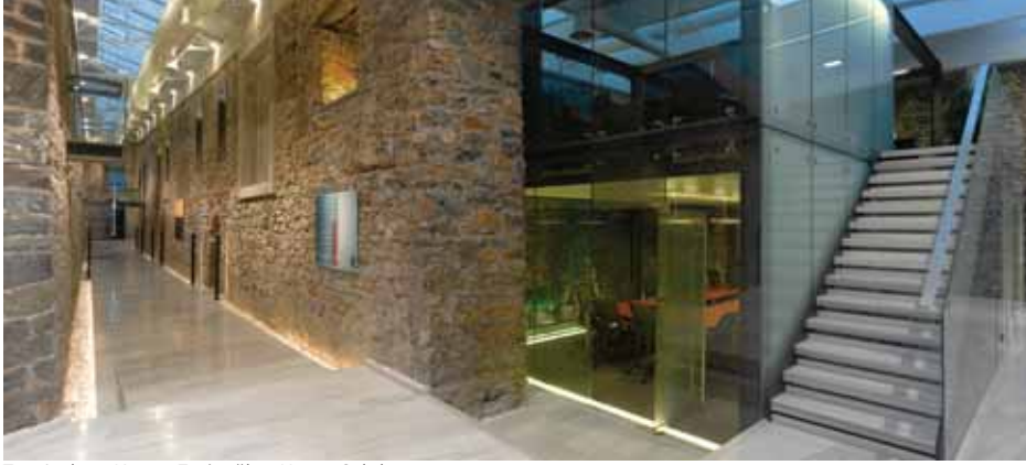
Tuz Ambarı, Kerem Erginoğlu - Hasan Çalışlar