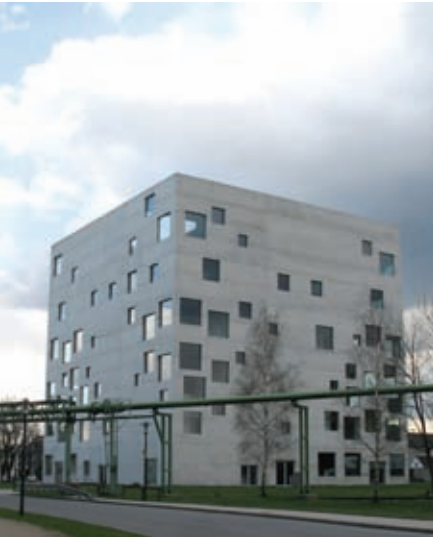
Zollverein Okulu - Essen

Geçtiğimiz yıllar içinde Pritzker Ödülü kazanan isimler arasında Peter Zumthor, Rem Koolhaas, Norman Foster, Renzo Piano, Herzog & de Meuron ve Jean Nouvel bulunuyor. Daha önce Pritzker Ödülü kazanmış Japon mimarlar ise Kenzo Tange, Fumihiko Maki ve Tadao Ando.