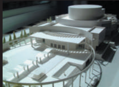
Adnan Saygun Sanat Merkezi