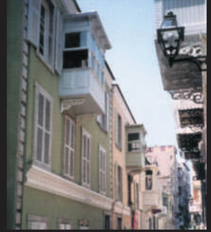
Bakımlı Cepheler Projesi