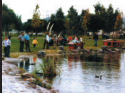
Meles Rekreasyon Alanı