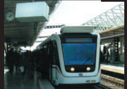
Kent İçi Ulaşım Yatırımları