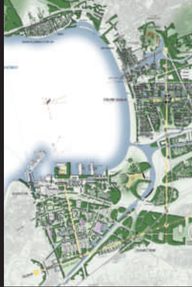
İzmir Liman Bölgesi için Kentsel Tasarım Uluslararası Fikir Yarışması