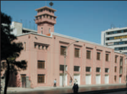
İzmir Kent Arşivi ve Müzesi