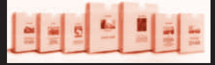
İzmir Kent Kitaplığı