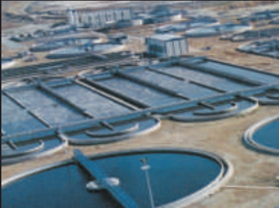
Büyük Kanal Projesi