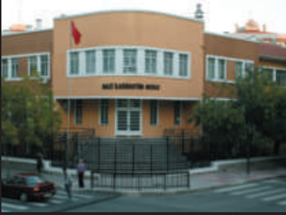
Tarihi Kamu Binalarının Yenilenmesi