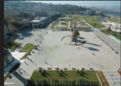
Konak Meydanı Düzenlemesi