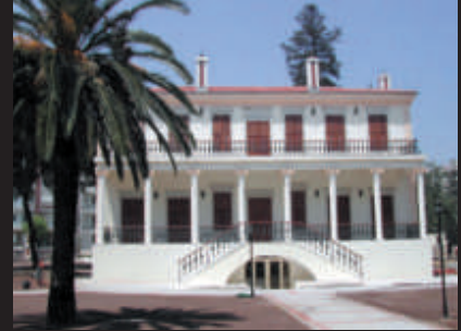
Murat Köşkü Restorasyonu - Bornova