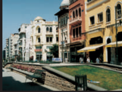
Mimar Kemalettin Moda Merkezi